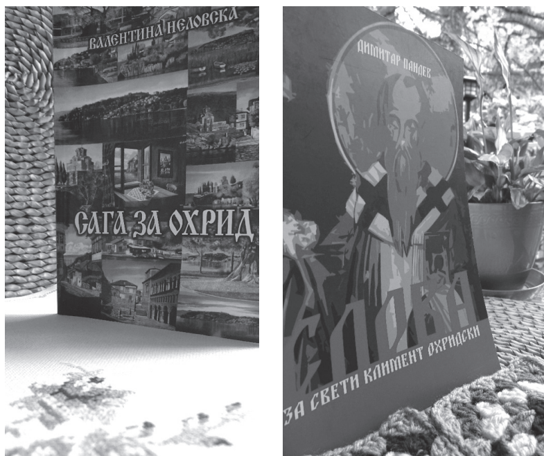
Слика 4, 5.

Када туристи посећују библиотеку, библиотекари постају туристички водичи чији је задатак да презентују и покажу библиотеку и њене збирке. Библиотека је жив организам који расте, корисници, културни туристи дају велики допринос да она буде центар културних збивања током лета, поготово јер је туристичка сезона у току.