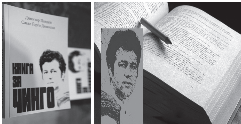
Слика 6, 7.

семинариста из 15 земаља света који су потврдили учешће на овој 54. Летњој школи: https://www.youtube.com/watch?v=d1uGSJjAGLo .