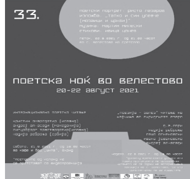
Слика 8, 9 и10.

би се надограђивала и у јавности добити позитивну слику о себи. Због тога треба предузети кораке да се приближи јавности, корисницима оно што библиотека има, нуди и даје на коришћење. Зато би наше библиотекарство требало да буде заступљено и у медијима.