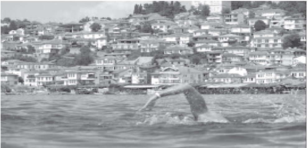
Слика бр. 8. Охридски пливачки маратон

Балкански фестивал народних песама и игара одржава се непрекидно од 1961. године, на коме учествују бројни уметници из С. Македоније, Србије, Црне Горе, Албаније и Бугарске.