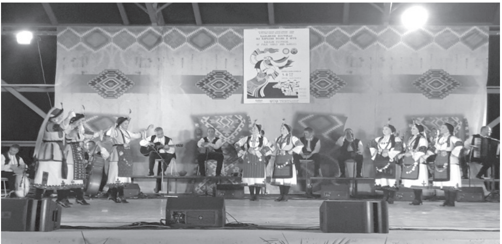
Слика бр. 7. Балкански фестивал народних песама и игара

У Охриду као туристичком центру одржавају се многе културне, верске и спортске манифестације попут: Богојављења - Водице, годишњице смрти Григора Прличева у организацији општине Охрид као и библиотеке која носи његово име, годишњице смрти Кирила Прличева - сина Григора Прличева, годишњица објављивања песме „Сердар“, културна манифестација „Прличеве беседе“ коју такође организује Охридска библиотека, спортско-рекреативни догађај „Охрид трчи“, као и бројни међународни и светски празници и догађаји.