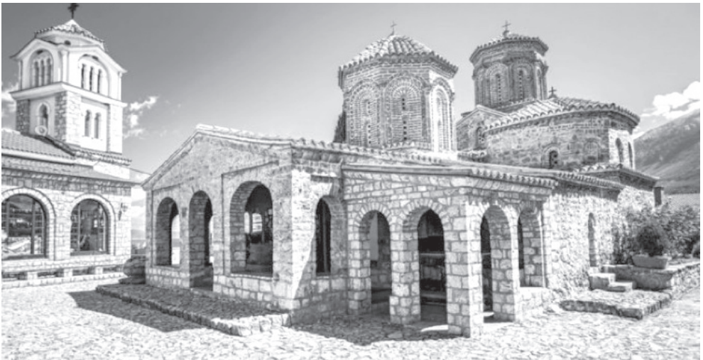
Слика бр. 3. Манастир Свети Наум

У посланици охридског архиепископа Јосифа 21. маја 1740. године наводи се да су „чуда и милости светог Наума били бројнији од звезда на небу”. Међутим, прве легенде и предања о његовим чудима објављена су у другој половини 19. века.