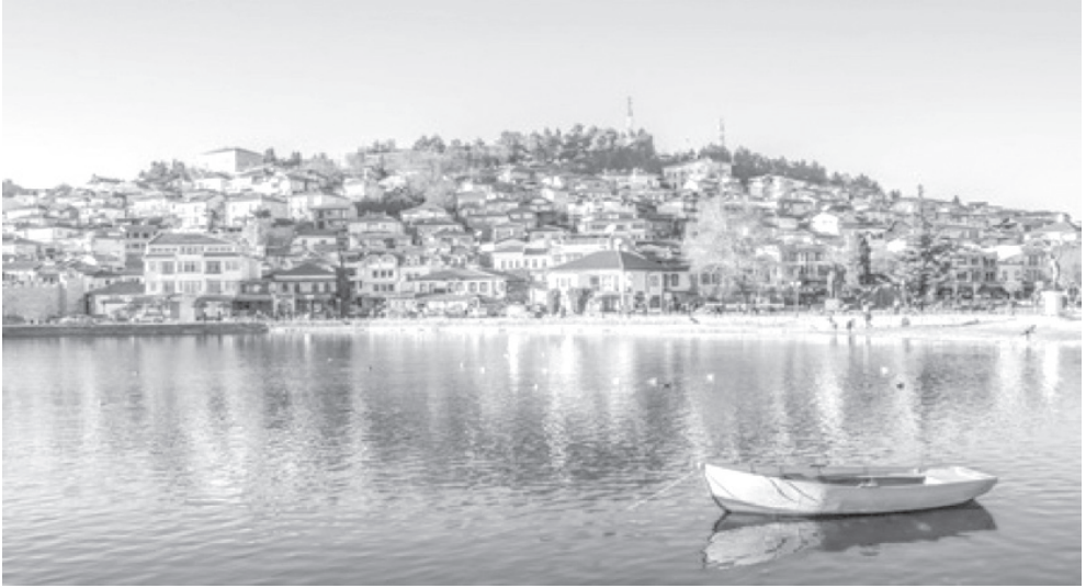
Слика бр. 1. Панорама Охрида

Покровитељ и заштитник града Охрида је Свети Климент Охридски, један од првих средњовековних словенских светитеља, научник, писац и просветитељ словенских народа. Свети Климент је заједно са Светим Наумом Охридским међу најистакнутијим ученицима Светог Кирила и Методија, који су створили глаголицу и ћирилицу и захваљујући њима учинили људе овог краја писменим.