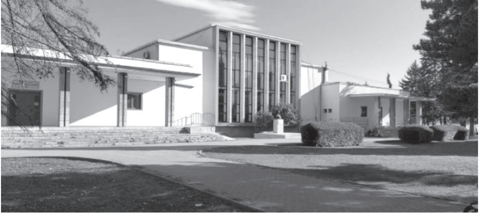
Слика бр. 11. Библиотека „Григор Прличев“ у Охридџ