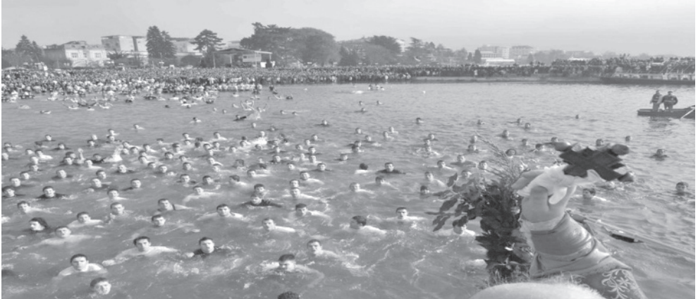
Слика бр. 5. Обележавање верског празника Богојављење - Водице у Охриду

У Охриду као туристичком центру одржавају се многе културне, верске и спортске манифестације попут: Богојављења - Водице, годишњице смрти Григора Прличева у организацији општине Охрид као и библиотеке која носи његово име, годишњице смрти Кирила Прличева - сина Григора Прличева, годишњица објављивања песме „Сердар“, културна манифестација „Прличеве беседе“ коју такође организује Охридска библиотека, спортско-рекреативни догађај „Охрид трчи“, као и бројни међународни и светски празници и догађаји.