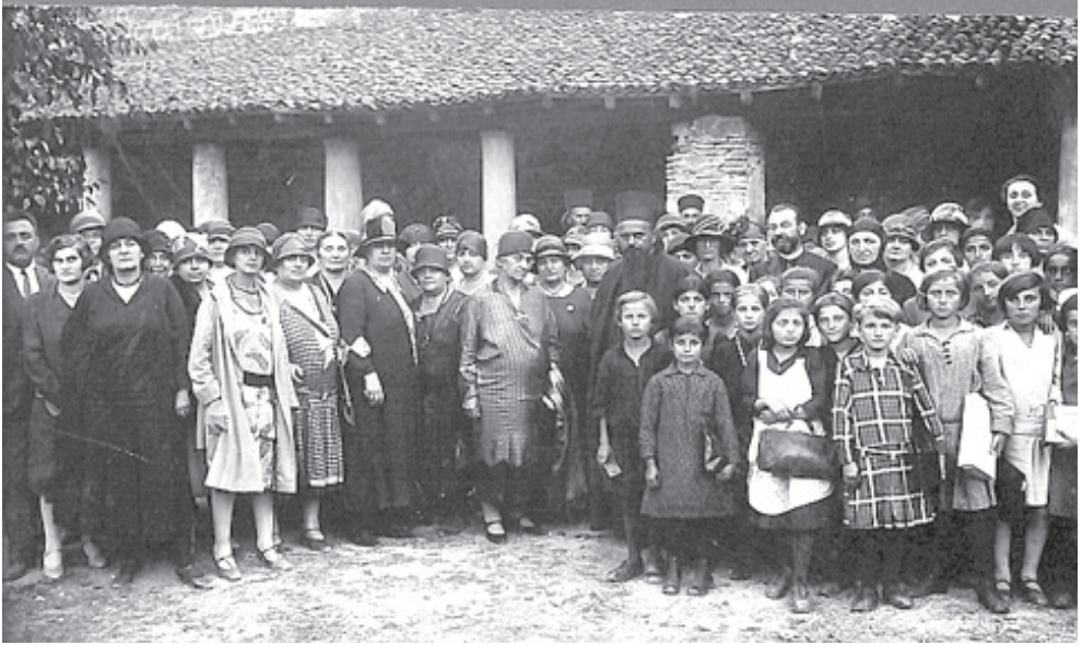
Слика бр. 4. Владика Николај Велимировић у Охриду са друштвом кнегиње Љубице из Панчева, 1928.

У Охриду је такође стварао и био и владика Николај Велимировић.