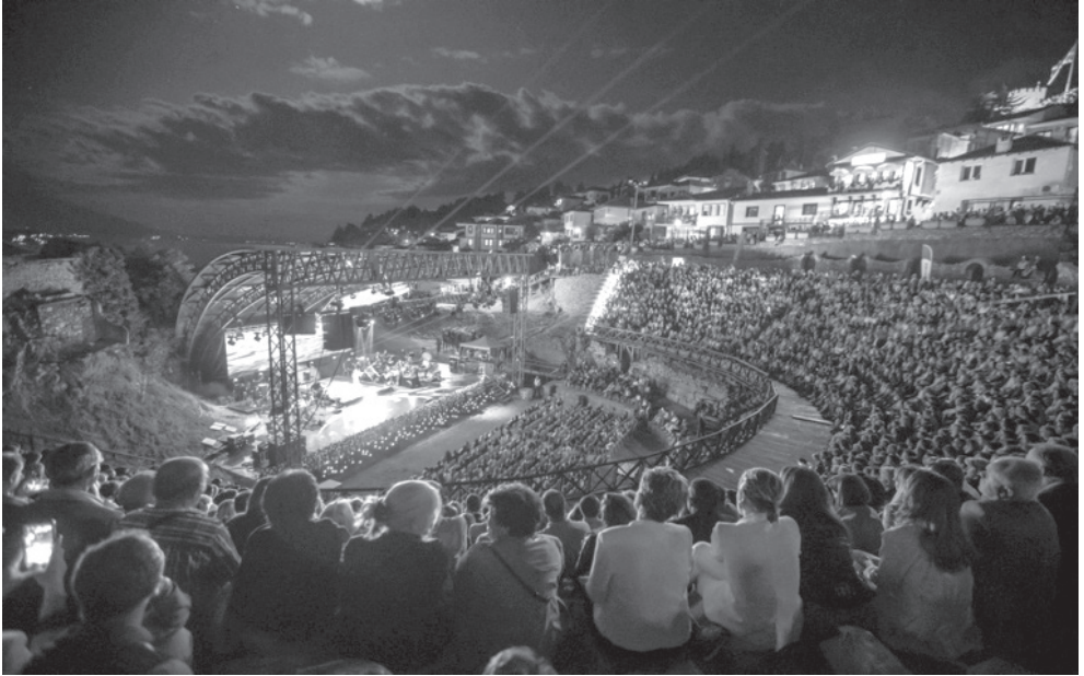
Слика бр. 6. Фестивал Охридско лето/локалитет Амфитеатар, Охрид

Министарство културе С. Македоније и спонзори. Председник С. Македоније покровитељ је фестивала.